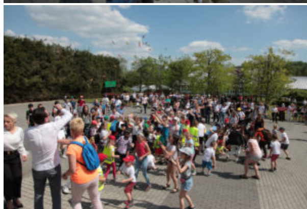
Tekst: CKZiU im. św. Jana Pawła II w Łapanowie