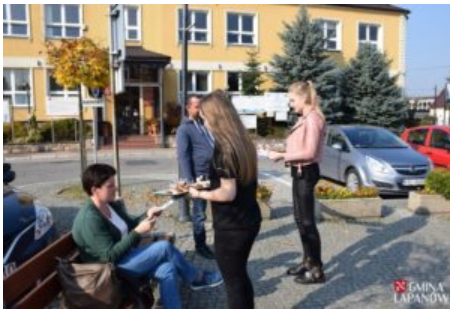
Kampania promująca darmowe porady prawne