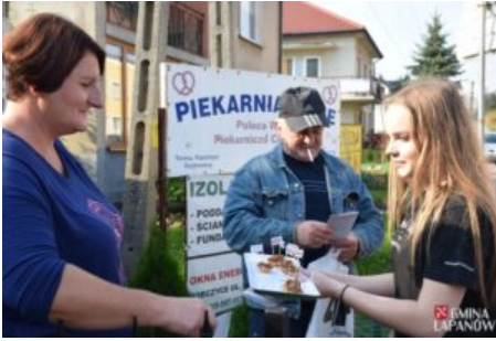
Kampania promująca darmowe porady prawne