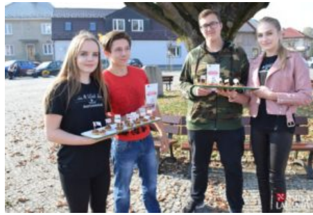
Kampania promująca darmowe porady prawne