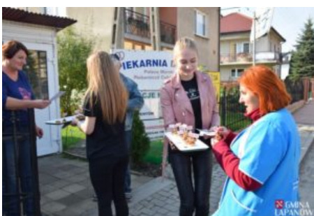
Kampania promująca darmowe porady