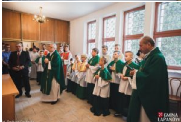
Tekst: Mirosław Drożdż