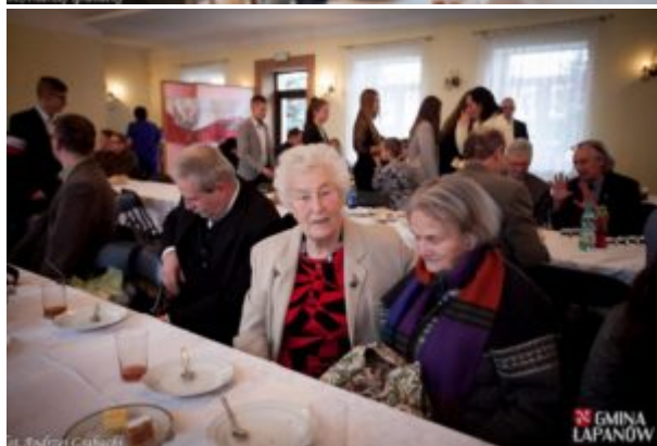
Tekst: Mirosław Drożdż