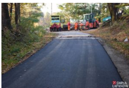
Remont drogi Kobylec-Chrostowa