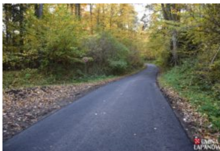
Remont drogi Kobylec-Chrostowa