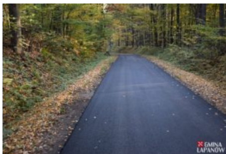
Remont drogi Kobylec-Chrostowa