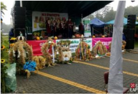
Święto Jabłka i Gruszki w Czaławiu