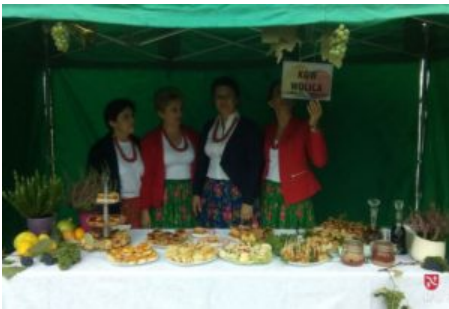
Święto Jabłka i Gruszki w Czaławiu