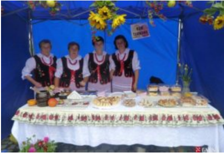
Święto Jabłka i Gruszki w Czaławiu