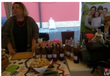
Święto Jabłka i Gruszki w Czasławiu