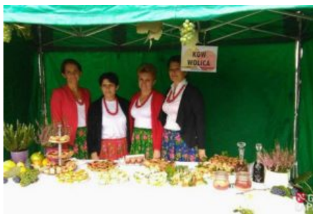
Święto Jabłka i Gruszki w Czasławiu