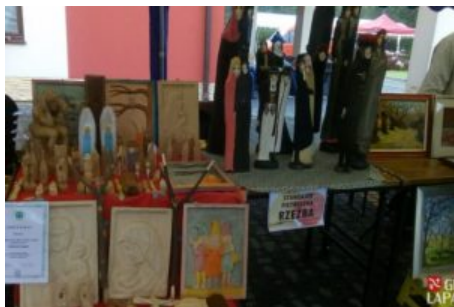
Święto Jabłka i Gruszki w Czasławiu