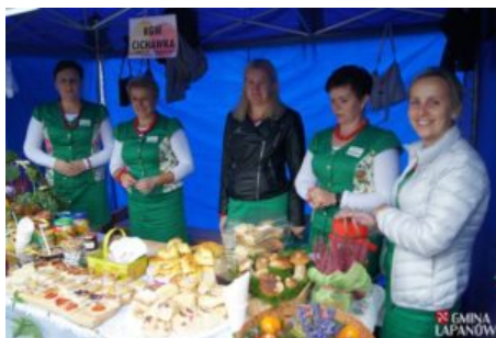
Święto Jabłka i Gruszki w Czasławiu