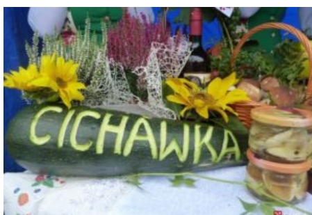
Święto Jabłka i Gruszki w Czasławiu