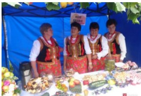
Święto Jabłka i Gruszki w Czasławiu