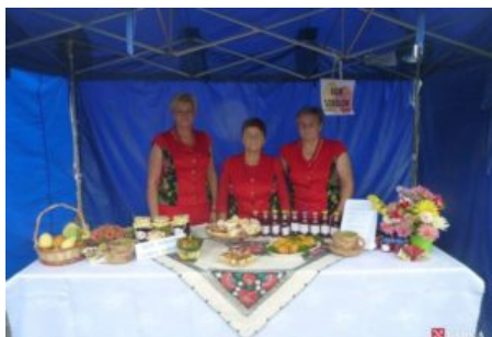
Święto Jabłka i Gruszki w Czasławiu