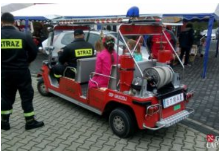
Święto Jabłka i Gruszki w Czaławiu