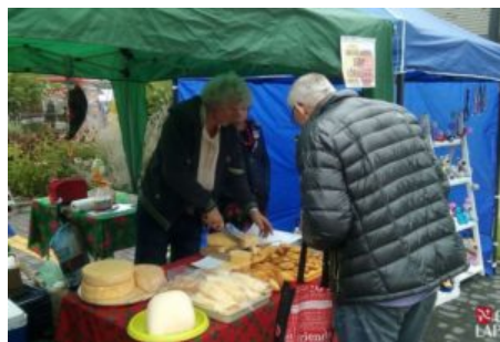
Święto Jabłka i Gruszki w Czaławiu