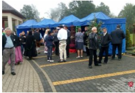
Święto Jabłka i Gruszki w Czaławiu