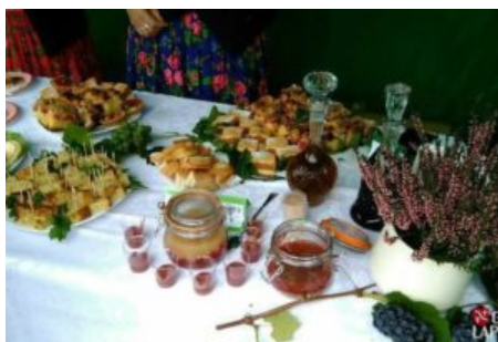
Święto Jabłka i Gruszki w Czasławiu