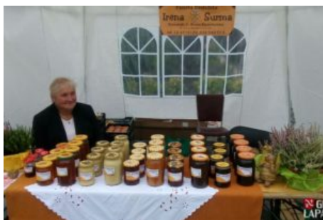
Święto Jabłka i Gruszki w Czasławiu