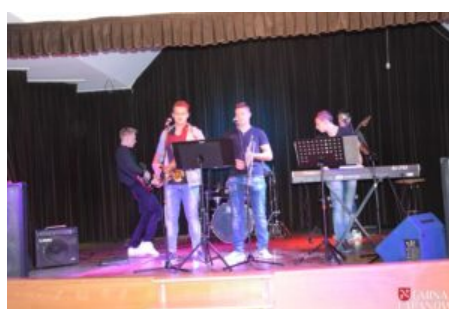
Wizyta delegacji z Balatonszarszo