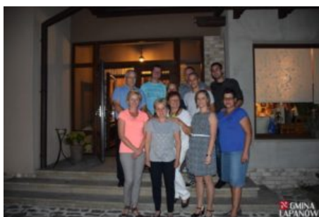
Wizyta delegacji z Balatonszarszo