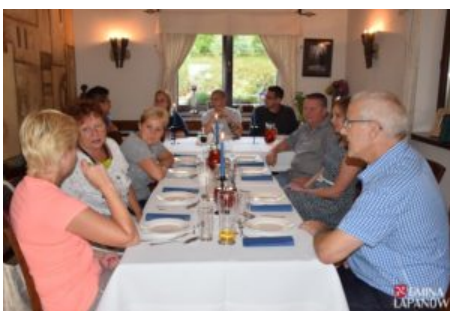
Wizyta delegacji z Balatonszarszo