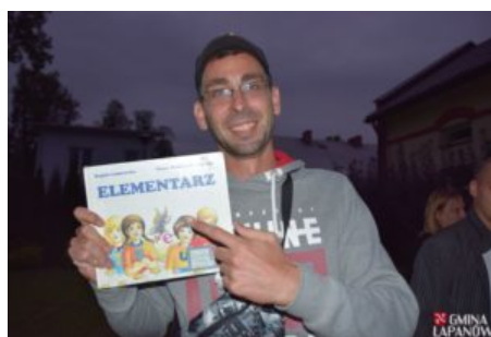
Wizyta delegacji z Balatonszarszo