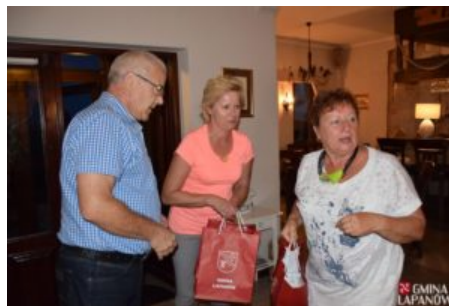
Wizyta delegacji z Balatonszarszo