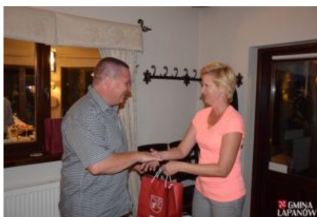
Wizyta delegacji z Balatonszarszo