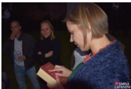
Wizyta delegacji z Balatonszarszo