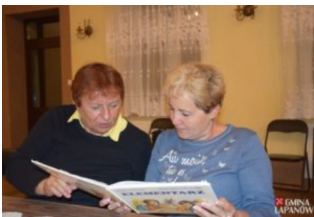
Wizyta delegacji z Balatonszarszo