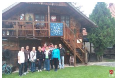
Wizyta delegacji z Balatonszarszo