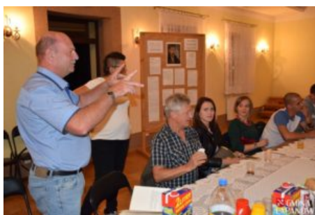
Wizyta delegacji z Balatonszarszo