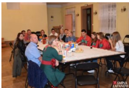
Wizyta delegacji z Balatonszarszo