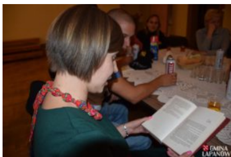
Wizyta delegacji z Balatonszarszo