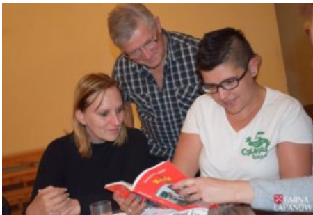
Wizyta delegacji z Balatonszarszo