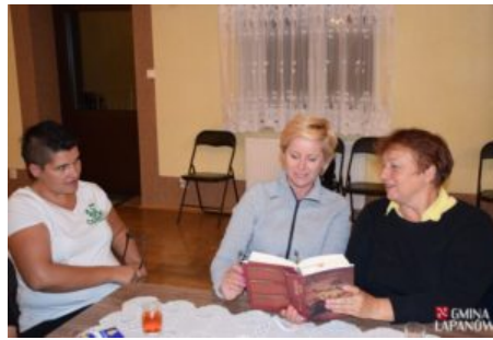
Wizyta delegacji z Balatonszarszo