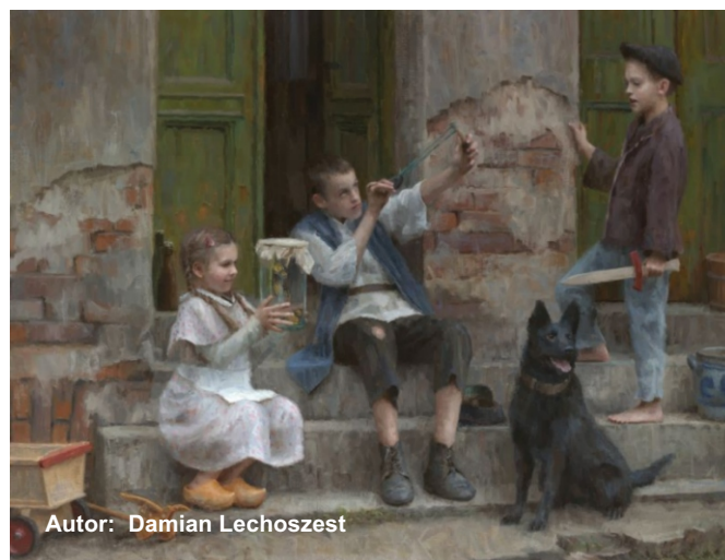
Autor: Damian Lechoszest

w Katowicach, Świętochłowicach, Jastrzębiu-Zdroju, Krakowie, Chrzanowie, Bochni, Ciężkowicach