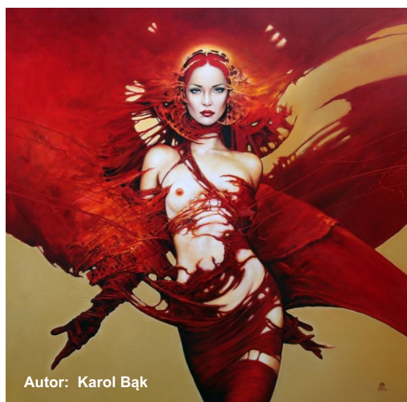
Autor: Karol Bąk

NIE - i - TYPOWE miejsca realizacji wystaw