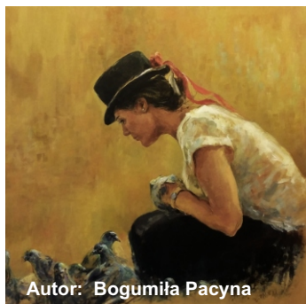
Autor: Bogumiła Pacyna