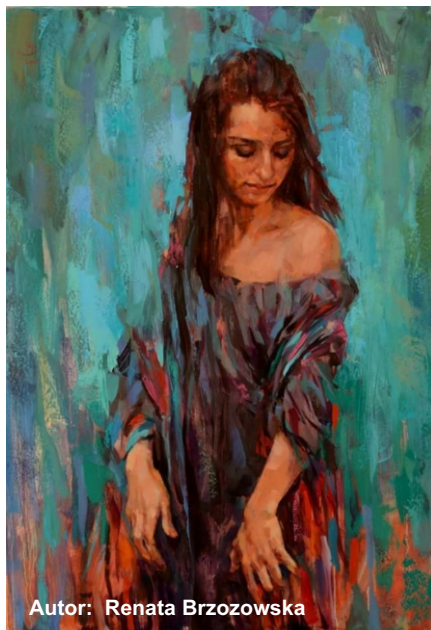
Autor: Renata Brzozowska