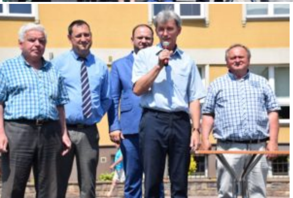
Tekst: Tadeusz Mazur